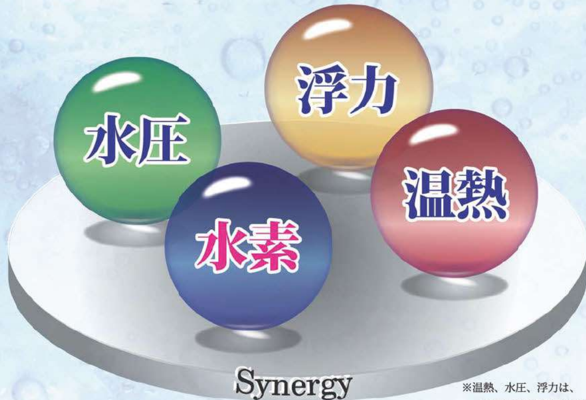
※温熱、水圧、浮力は、一般的な入浴による効果です。

浴水を効率よく、安定的に電気分解しますので、一日中、いつでも手軽に準備なしで濃度の高い電解水素浴が楽しめます。