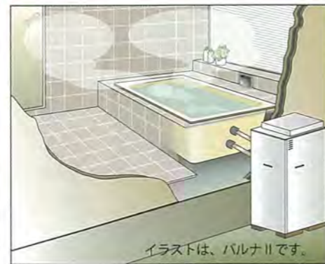
イラストは、バルナIIです。